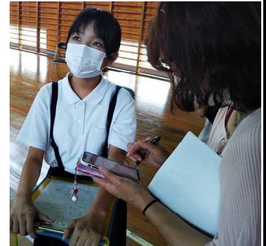
(授業後も熱心に質問しています↑) (記者の質問に真剣に答えています↑)