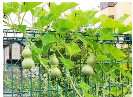
(↑立派な「ひょうたん」もできています)