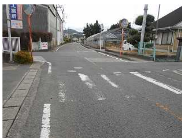
【林工業所前】 ビフォー