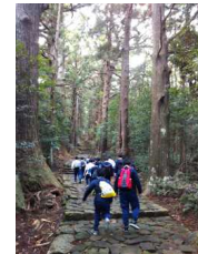
修学旅行 熊野古道 大門坂