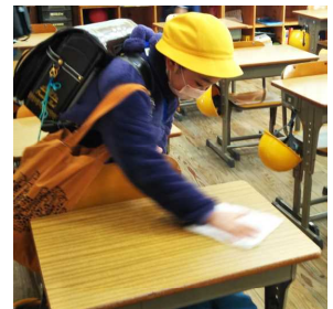
「鬼は外、福は内！」(2年) 「放課後の一コマです」(4年) 「糸電話 楽しんでいます」(3年) 「自分の机は自分で消毒」(5年)