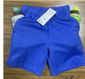
両サイドポケット