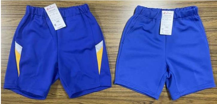
左：現行体操服 → 右：新体操服