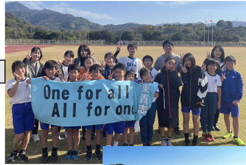
【令和4年度東貴志小学校駅伝チームメンバー】

11月19日(土)に桃源郷運動公園で行われた桃源郷駅伝競走大会に男女とも参加し、共に11位でした。(男子は17チーム中、女子は18チーム中)6年生の[ ]さんが、1区3位で表彰されました。児童数が少ない本校としては大健闘の結果です。サポートメンバーも含め、 16名の児童が練習からこつこつ努力を重ねました！保護者の皆様もご協力ありがとうございました。