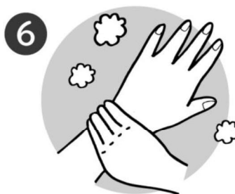
6 手首ももう一方の手でねじるようにあらう