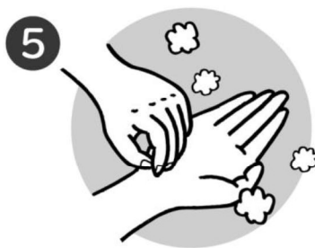
5 指先とつめの間をていねいにこする