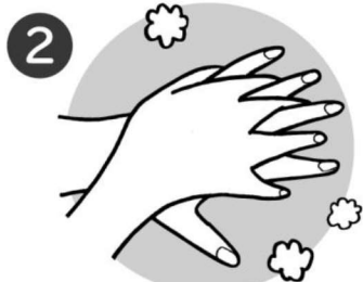
2 手のこうを反対の手でのばすようにこする