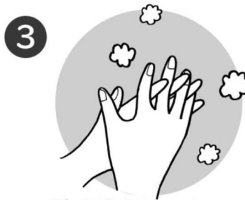
3 指の間を両手を組み合わせるようにあらう