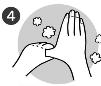
4 親指はもう一方の手でねじるようにあらう