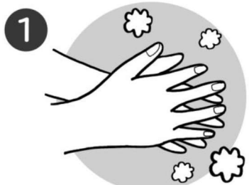
1 両手のひらをあわせてよくこする