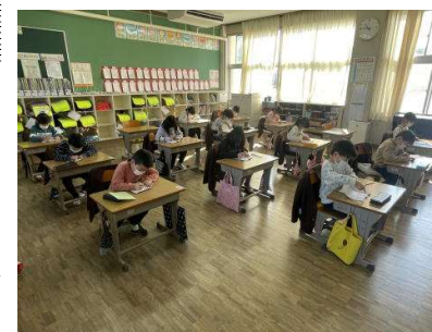
1年生 初めての競書会

日頃の黒板視写や漢字練習ノートとは少し違い、子供たちにとっては、じっくり落ち着いて字を書く貴重な機会になっています。