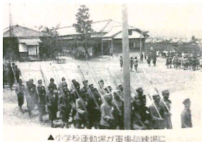
▲小学校運動場が軍事訓練場に 当時の本校運動場の様子

じぶんとともだちもたいせつにすることがへいわとおもいます。みんなでなかよしてあそびたいです。