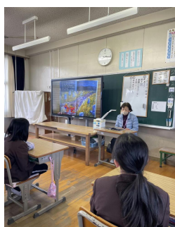
スマイルさん読み能登半島地震募金活動 聞かせ（5年生）