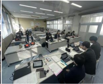
実践発表会：オンライン研修