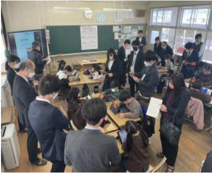
実践発表会：授業公開

1月末に、文部科学省研究指定「リーディングDXスクール事業」の実践発表会を実施しました。1月25日：集合での授業公開（録画）→授業動画限定配信→1月30日：オンライン研修会（県内外から75名参加）を行い、関係各位から本校の子供たちと職員のがんばりを評価していただきました。