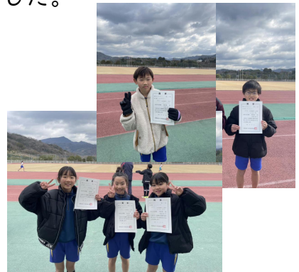
長距離走大会入賞者