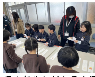
現1年生と新入予定児 との交流会