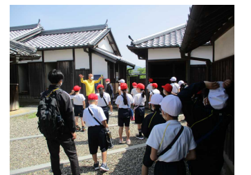
春林軒で熱心に説明を聞いています。