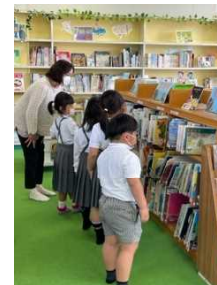
大好きな図書の本

朝の登校の登校から、朝の運動等、高学年が先頭に立ってみんなを引っ張っていきます。