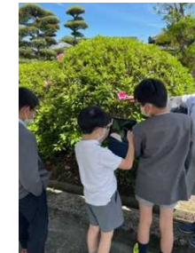
タブレットを使って学習