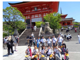
清水寺の仁王門前