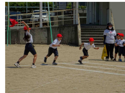
【令和4年度の県内の状況】