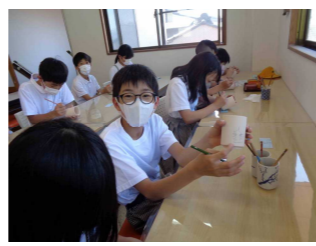
清水焼の絵付け体験