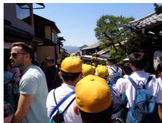
清水寺門前商店街