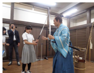
太秦映画村で役者さんと