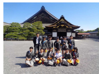
二条城、二の丸御殿