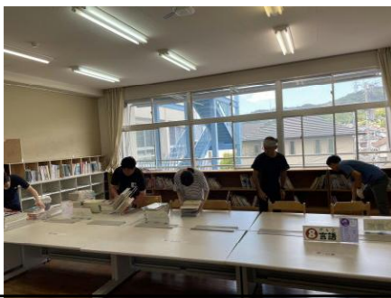
第2図書室の移動をしました。空調設備の整った教室に移動したので、学習しやすい環境になります。総合や社会科など調べ学習で活用してください。