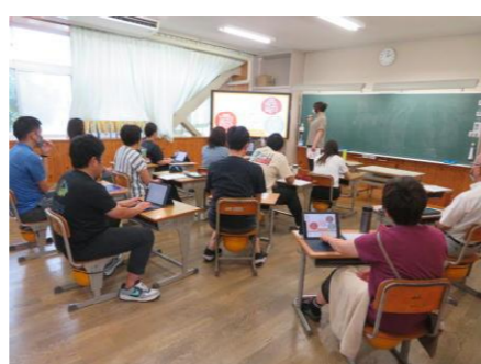
スクールカウンセラーに子供理解について研修をしていただきました。