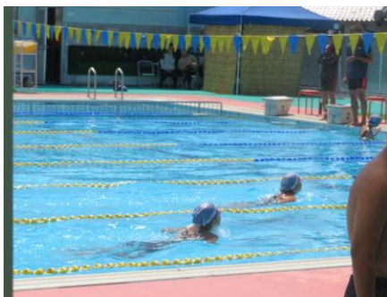
6年生は水泳の特別練習に参加し、全員が記録更新することができました。本当によくがんばりました。貴水泳大会が開催されました。