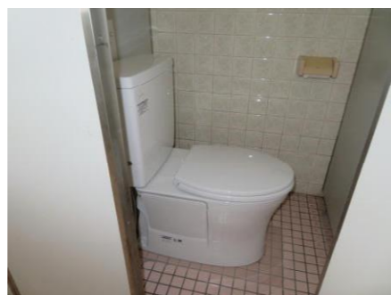
1・2階の女子トイレを1カ所ずつ洋式化しました。少しは使用しやすくなると思います。