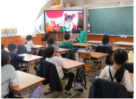
かしの木グループさんの読み聞かせです。学期に1回来てくださいます。どの学年も集中して読み聞かせを聞いています。