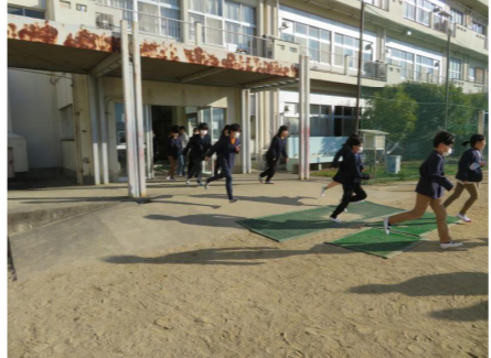
火災の避難訓練をしました。「おかしもち」をしっかりと守って運動場へ避難しました。