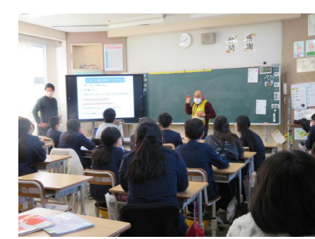
6年生は、薬物乱用防止教室に参加し、薬物の恐ろしさやどう行動するべきかを学習しました。