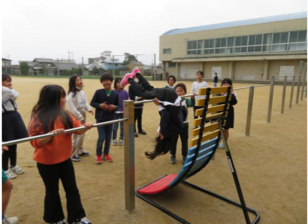
鉄棒のところに逆上がり補助器具を設置しました。たくさんの子が逆上がりに挑戦しました。