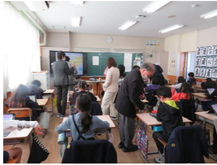
3年生が、算数の「□を使った式」の研究授業をしました。この後、授業の進め方について協議しました。