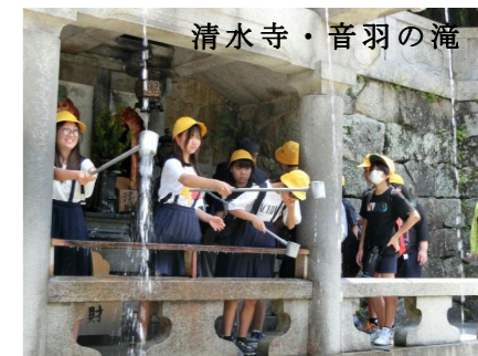
清水寺・音羽の滝