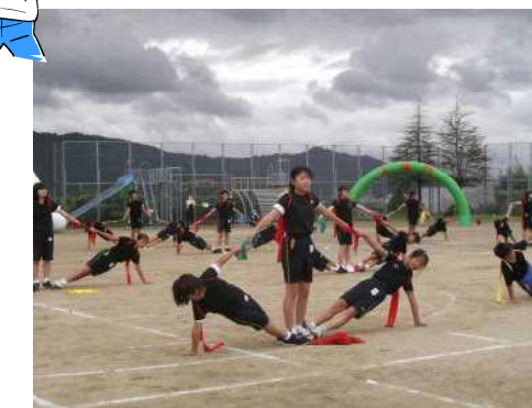
ソーランディスタンス（456学年）