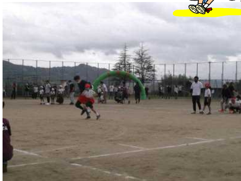
デカパンをつなげ！（中学年親子）