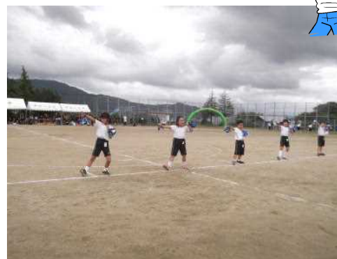
WAになっておどろう～ところをひとつに～ （123学年）