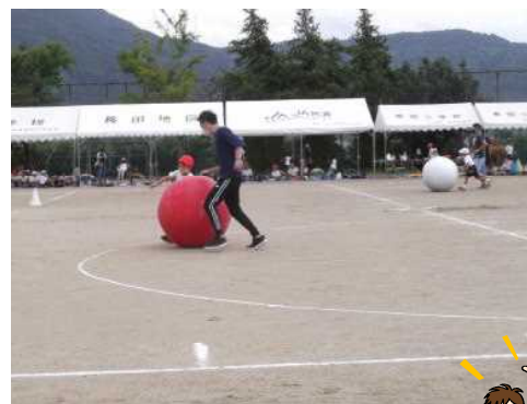
大玉ころりん（低学年親子）