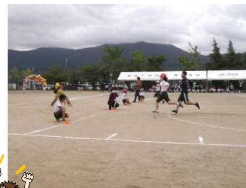
親と駆ける（高学年親子）