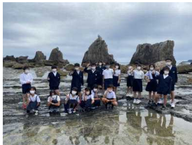
アドベンチャーワールド