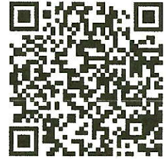
連絡メール2 保護者ログイン