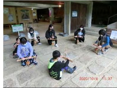
火起こし体験。煙は出たかな?

10月8日、修学旅行に出かけていない中学1年生と小学生が、校外学習に出かけました。生憎の雨でしたが、午前「紀伊風土記の丘」で竪穴住居や資料館の見学、火起こし体験などをしました。お弁当を食べた後、最近、海南市内にオープンした図書館、「海南 nobinos」へ移動し、見学したり読書を楽しんだりしました。