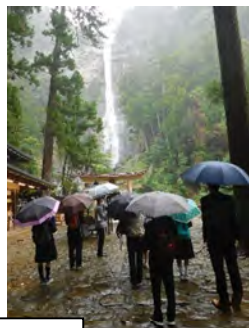
那智の滝の荘厳さに感動!