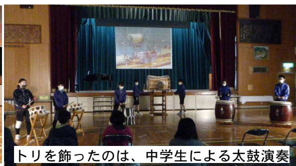
トリを飾ったのは、中学生による太鼓演奏

今年度、文化祭や敬老会などの行事が中止になったので、最後の参観授業は感染対策を行い、全校児童生徒による学習発表会を開催しました。