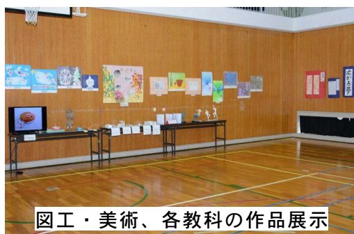
図工・美術、各教科の作品展示