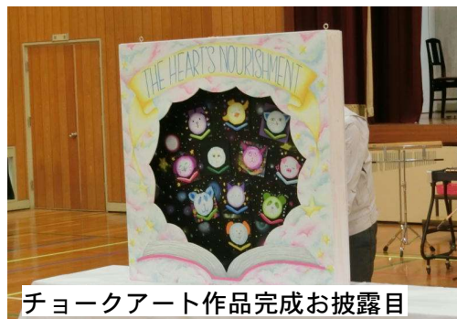
チョークアート作品完成お披露目