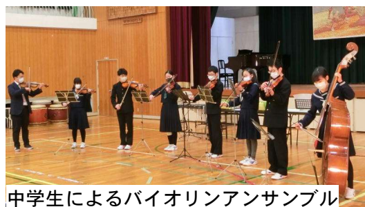
中学生によるバイオリンアンサンブル