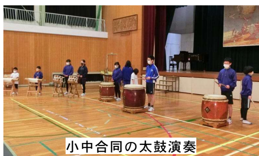
小中合同の太鼓演奏