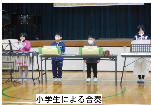
小学生による合奏