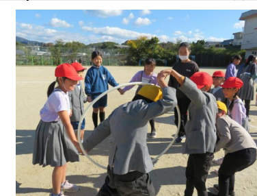
11月に行きは市面です