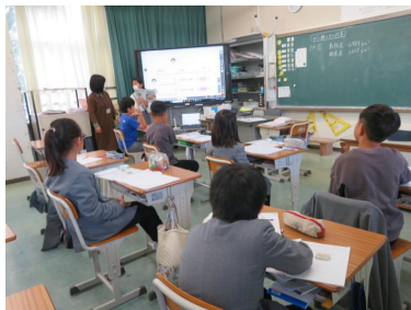
育友会役員の皆様ご準備ありがとうございました。

11/7授業参観・親子の集いを行いました。授業参観は、子供達はいつも以上に頑張っ