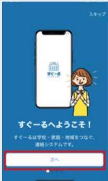
アプリチュートリアル