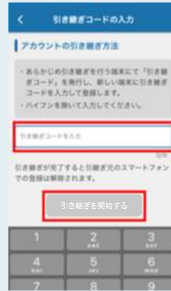
引き継ぎコード入力