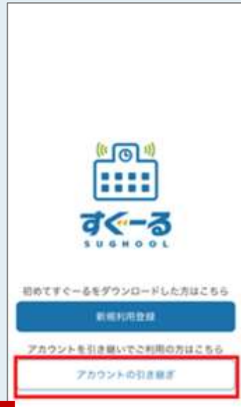
アプリ使用開始画面