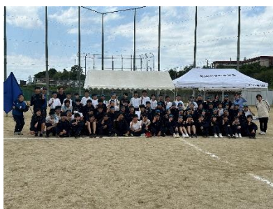
赤・みんなで 集合写真★

テスト発表期間中には、先生にワークのわからないところを聞いたり、放課後の補習に積極的に参加したりと一生懸命中間テストに向けて取り組んでいる姿が見られました。結果の良い、悪いはそれぞれあると思いますが、期末テストに向けてより一層頑張らしましょう。