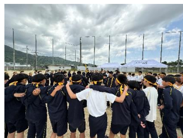
黄・円陣で一致団結!